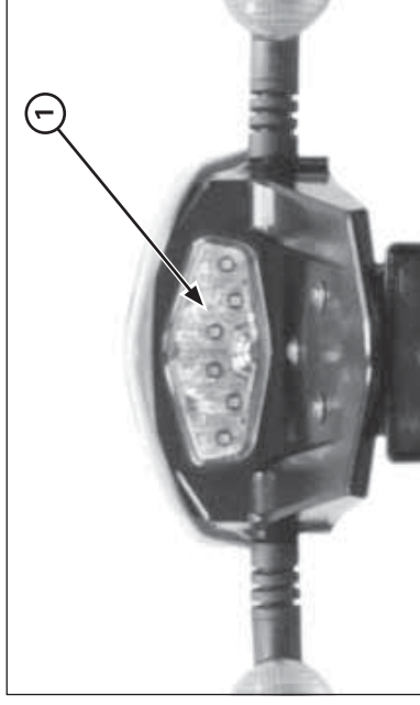
(1) LUZ DE FRENO

Comprobación de la línea de señales: Conecte los terminales del conector 2P (blanco) del relé de señalización de giro con un cable puente.