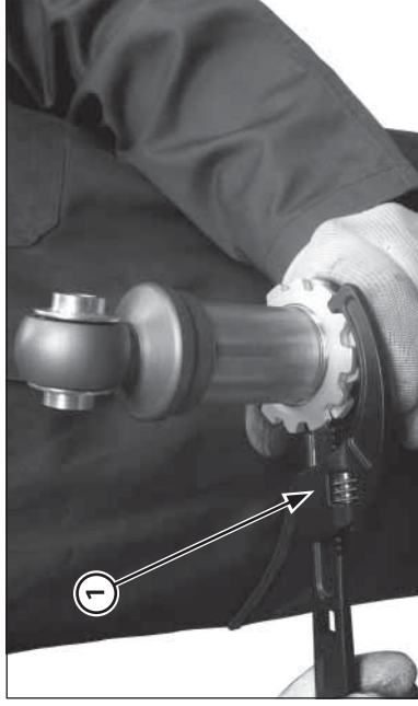
(1) LLAVE DE ARCO