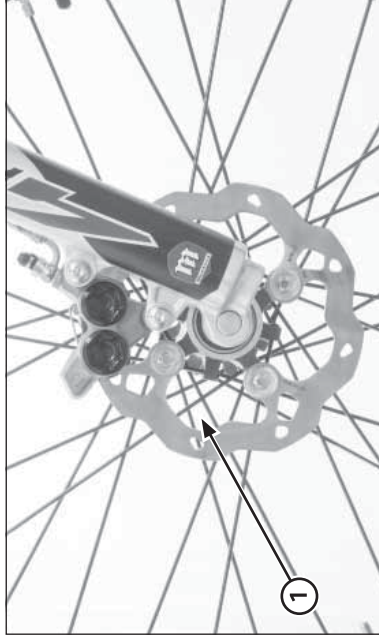
(1) DISCO DE FRENO

Si cualquiera de las pastillas está desgastada según las indicaciones, habrá que cambiar las dos pastillas.