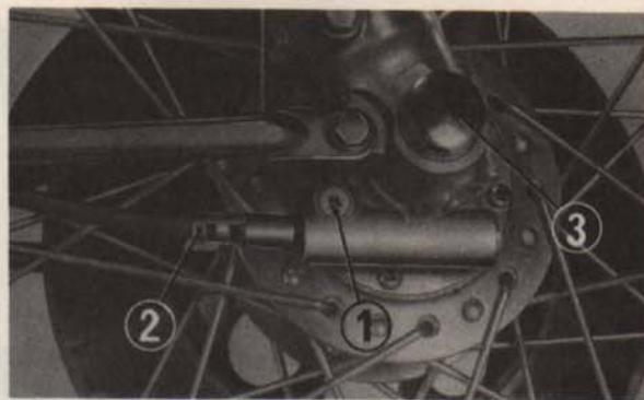
Fig. 4-2 (1) Vis de fixation (2) Câble de l'indicateur de vitesses (3) Axe de roue avant