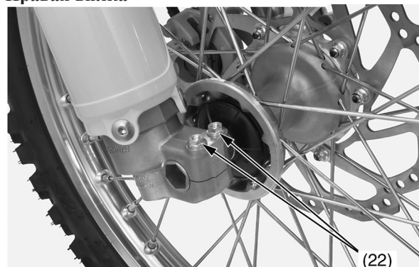
(22) правые стяжные болты оси