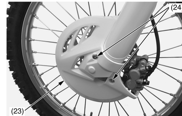
(23) кожух тормозного диска (24) болты кожуха

19. Установите регуляторы усилий отбоя (25) и сжатия (26) в их исходные положения.