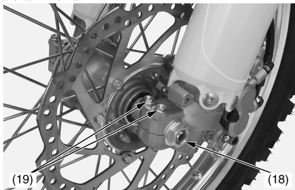
(18) гайка передней оси (19) левые стяжные болты оси

14. Установите руль (20), установочные прокладки, нижнюю часть держателя руля, шайбы и нижние крепежные гайки руля (21) и затяните их до требуемого момента: