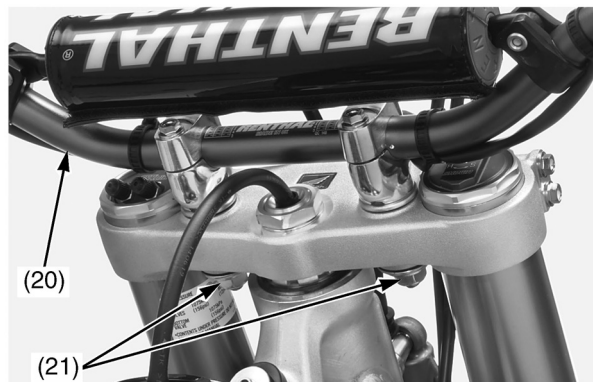
(20) руль (21) установочные прокладки, шайбы и нижние крепежные гайки

15. Установите номерную табличку ( стр. 129).