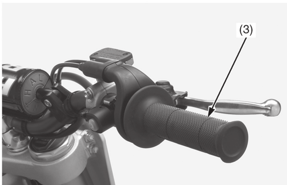
(3) рукоятка акселератора

2. Проверьте плавность хода рукоятки акселератора (3) во всех положениях руля. В случае возникновения неисправностей обращайтесь к официальному дилеру Honda.