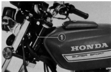
(1) Cabo do Acelerador

Verifique se a manopla do acelerador funciona suavemente desde a posição totalmente aberta até a totalmente fechada, e em todas as posições do guidão. Inspeccione as condições do cabo do acelerador, desde a manopla até o carburador. Se o cabo estiver partido, torcido ou colocado de forma incorreta, deverá ser trocado ou colocado na posição certa. Verifique a tensão do cabo com o guidão totalmente virado para a esquerda e para a direita.