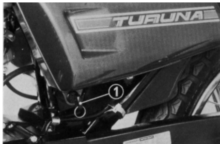
(1) Chave de Ignição

O elemento do filtro de ar deve ser limpo a cada 6000 km. Se sua motocicleta for usada em locais com muita poeira, será necessário limpar o filtro com mais frequência. Sua concessionária HONDA poderá determinar os intervalos corretos para esse serviço, de acordo com suas condições particulares de uso.