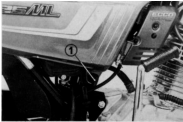
(1) Chave de ignição

Sua concessionária HONDA poderá determinar os intervalos corretos para esse serviço de acordo com suas condições particulares de uso.